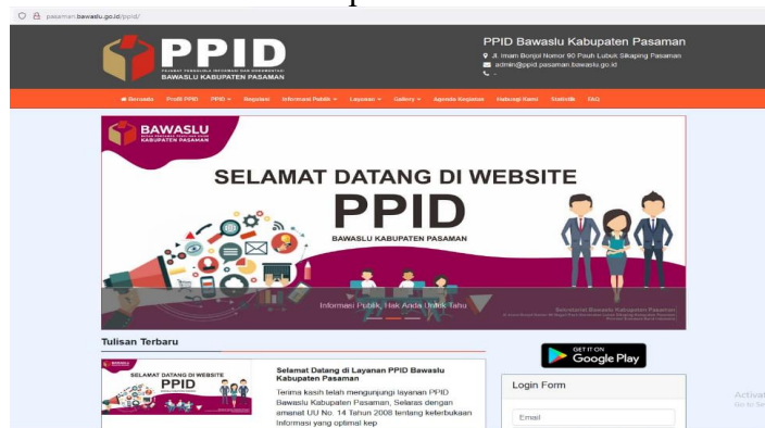
Gambar 3 : Tampilan Beranda Website

Bawaslu Kabupaten Pasaman selalu berupaya memberikan kemudahan dan membangun keterbukaan informasi dengan memanfaatkan perkembangan teknologi. Masyarakat bisa mengajukan permohonan informasi dan memberikan saran secara online/daring melalui portal website PPID Bawaslu Kabupaten Pasaman alamat url : http://pasaman.bawaslu.go.id/ppid/ . Dengan adanya sarana permohonan online ini memudahkan masyarakat untuk mengajukan permohonan informasi tanpa harus datang langsung ke PPID Bawaslu Kabupaten Pasaman.