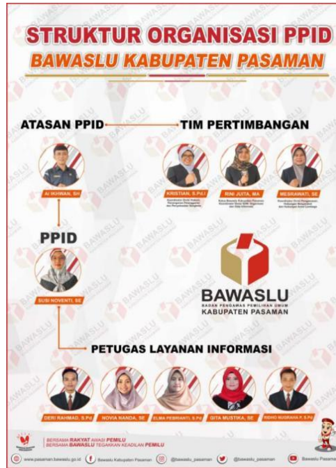
Gambar 1 : Struktur Organisasi PPID Bawaslu Kabupaten Pasaman

Kabupaten Pasaman Nomor : 016/HM.00.02/K.SB-06/02/2022 Tentang Tim Keterbukaan Informasi Publik di Lingkungan Badan Pengawas Pemilihan Umum Kabupaten Pasaman Tahun 2022, sebagaimana struktur di bawah ini :