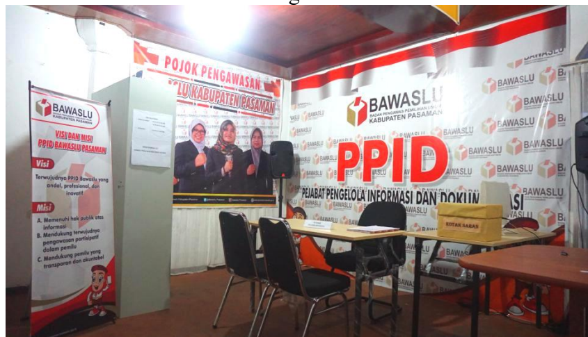
Gambar 2 : Ruangan PPID

PPID Bawaslu Kabupaten Pasaman membuka layanan permohonan Informasi pada hari kerja Senin s/d Jumat jam 09:00 s/d 15:00 WIB, yang beralamat di Jln. Imam Bonjol Nomor 90 Nagari Pauh Kecamatan Lubuk Sikaping Kabupaten Pasaman. Dalam layanan permohonan informasi, PPID Bawaslu Kabupaten Pasaman menyediakan Informasi secara gratis (tidak dipungut biaya), sedangkan untuk penggandaan, pemohon dapat melakukan penggandaan/fotokopi sendiri disekitar Kantor Bawaslu Kabupaten Pasaman. Biaya penggandaan ditanggung Pemohon, atau Pemohon dapat menyediakan CD, Flash Disk untuk merekam data dan informasi yang diminta.